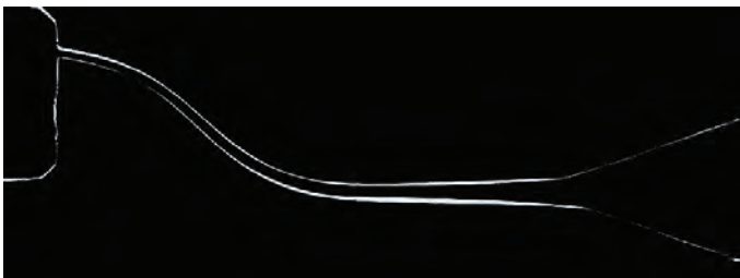
Рис 1. PROGLIDER™

PROGLIDER™ больше сохраняет анатомию корневого канала при создании "ковровой дорожки", чем ручные инструменты, используя которые трудно избежать транспортировку, образование ступенек и смещения апекса корневых каналов.