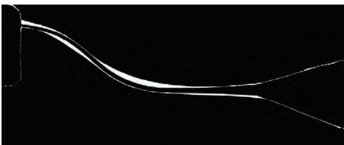
Рис 2. Стальной ручной инструмент.

Отклонения при формировании "ковровой дорожки" (уступы, ступеньки, транспортировка канала, смещение апекса).